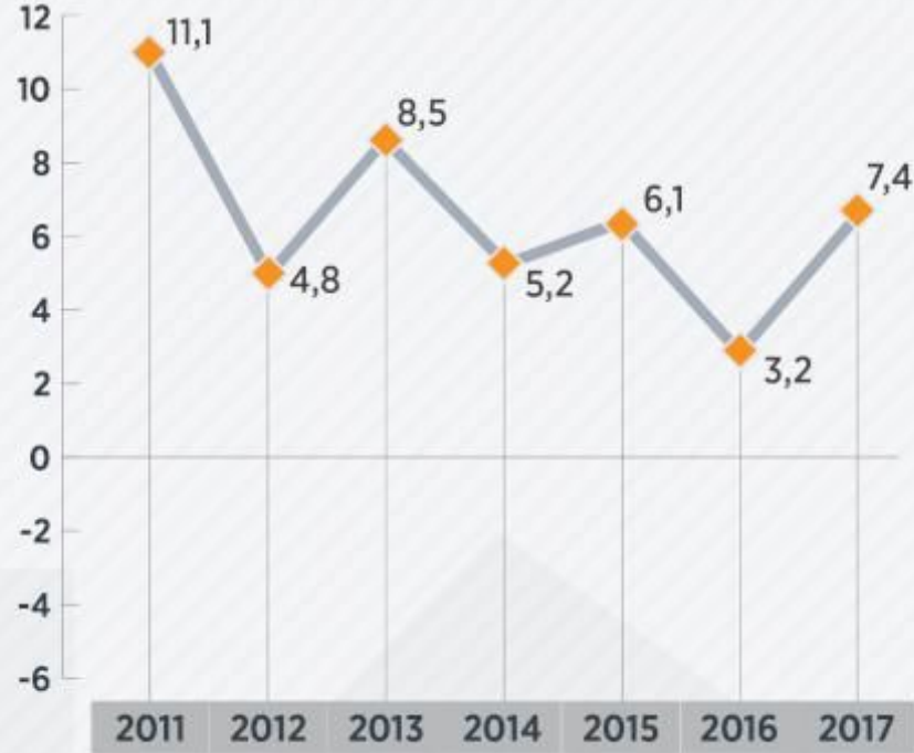
YILLARA GÖRE ORTALAMA

Üretim yöntemine göre cari fiyatlarla GSYH, 2017'de bir önceki yıla göre yüzde 19 artarak 3 trilyon 104 milyar 907 milyon lira olarak gerçekleşti