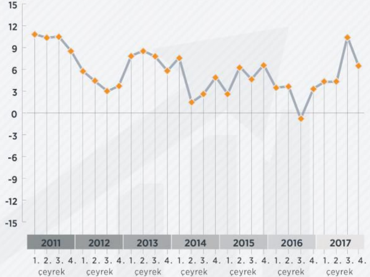
■ TÜRKİYE EKONOMİSİ 2017 YILINDA YÜZDE 7,4 BÜYÜDÜ

Üretim yöntemine göre cari fiyatlarla GSYH, 2017'de bir önceki yıla göre yüzde 19 artarak 3 trilyon 104 milyar 907 milyon lira olarak gerçekleşti